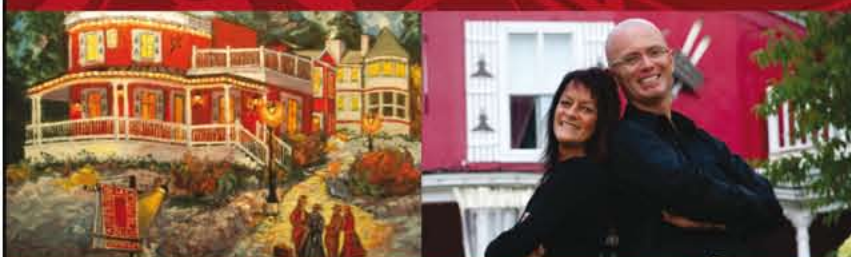
Table aux Saveurs du Terroir MD certifiée

En collaboration avec le journal St-Donat.