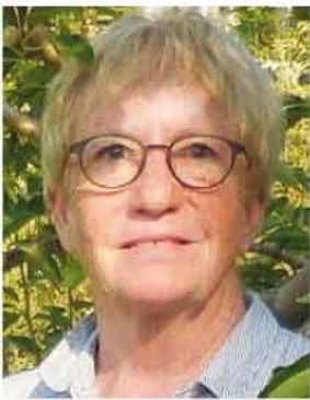
par Gertrude Lafond Nielly Pour le comité de Liturgie